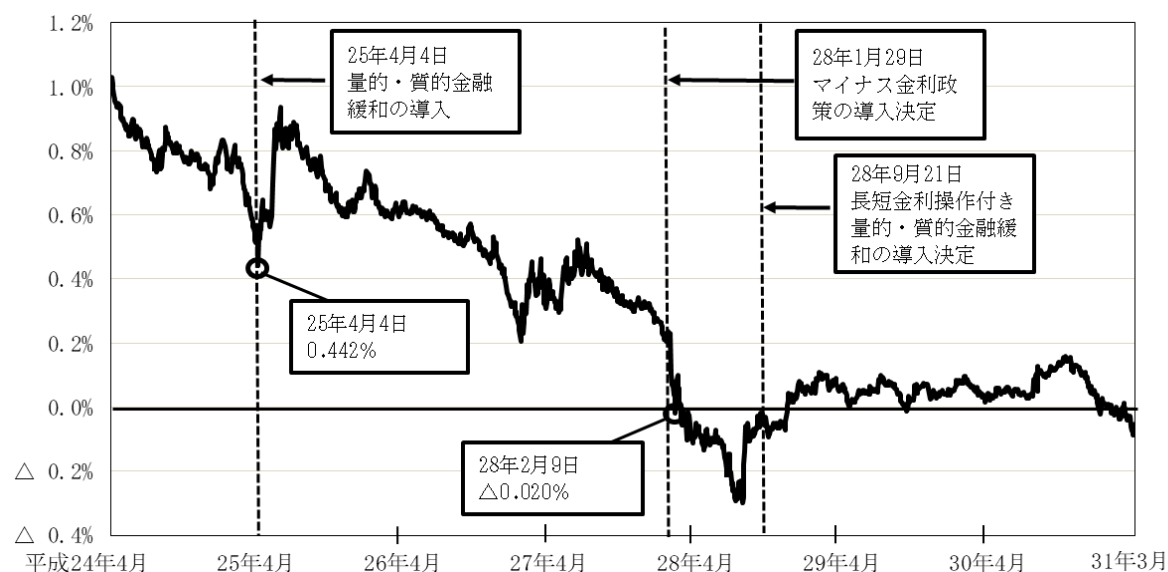
図表0-1 長期金利（10年国債の市場金利）の推移

25年4月の量的・質的金融緩和の導入以降、市場における長期金利の代表的な指標である10年国債の市場金利は、図表0-1のとおり、同月には一時0.4%台まで低下し、さらに、28年1月のマイナス金利政策の導入決定後の同年2月には0%を下回ってマイナスの水準となった。そして、その後も同年9月の長短金利操作付き量的・質的金融緩和導入決定以降0%程度で推移するなど、近年、低金利の状況が続いている。